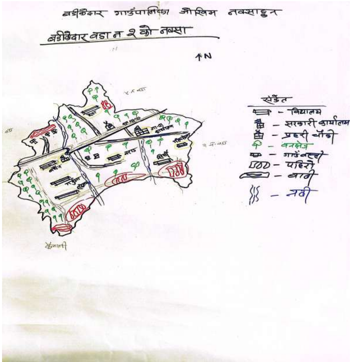
तलिका १८: वडा नं २ बाढीवाट हुन सक्ने संभावित जोखिम विश्लेषण जोखिम नक्सांकन