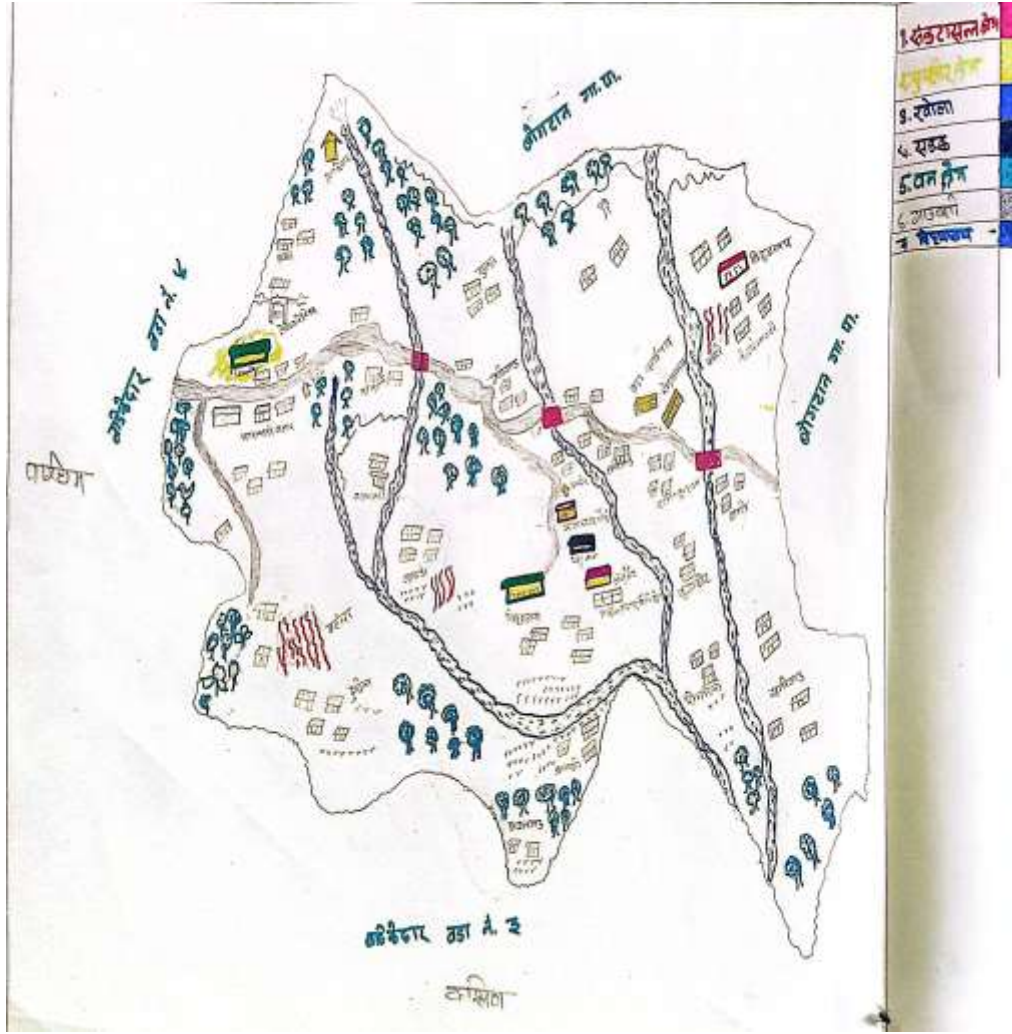
तलिका २१: वडा नं ५ बाढीवाट हुन सक्ने संभावित जोखिम विश्लेषण जोखिम नक्सांकन